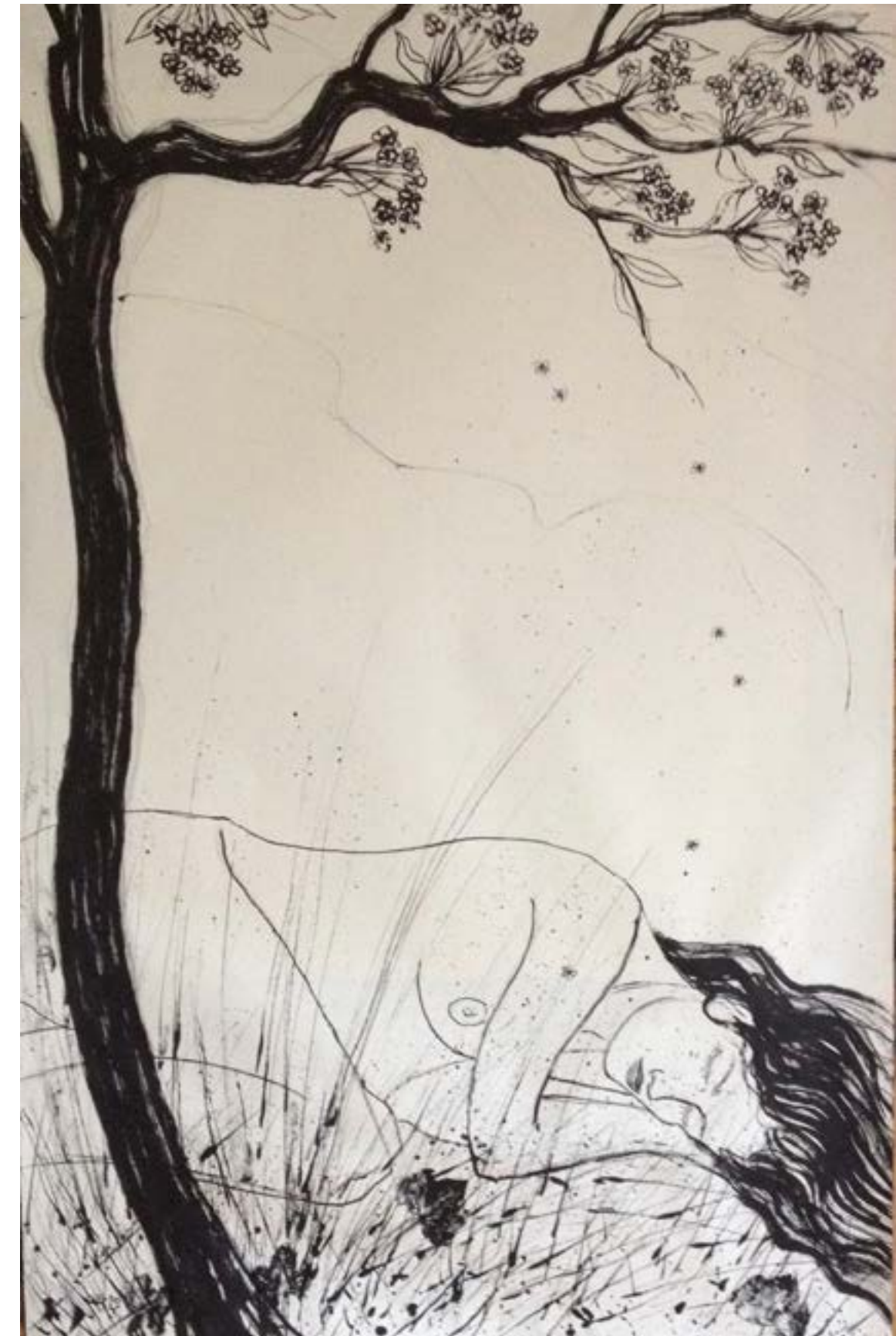
Tekening: Geert van der Pol

Ik was een meisje zoals meisjes zijn: zittend bij een raam en wegdromend in het landschap, kijkend naar kleine dingen, klaar voor het grote.