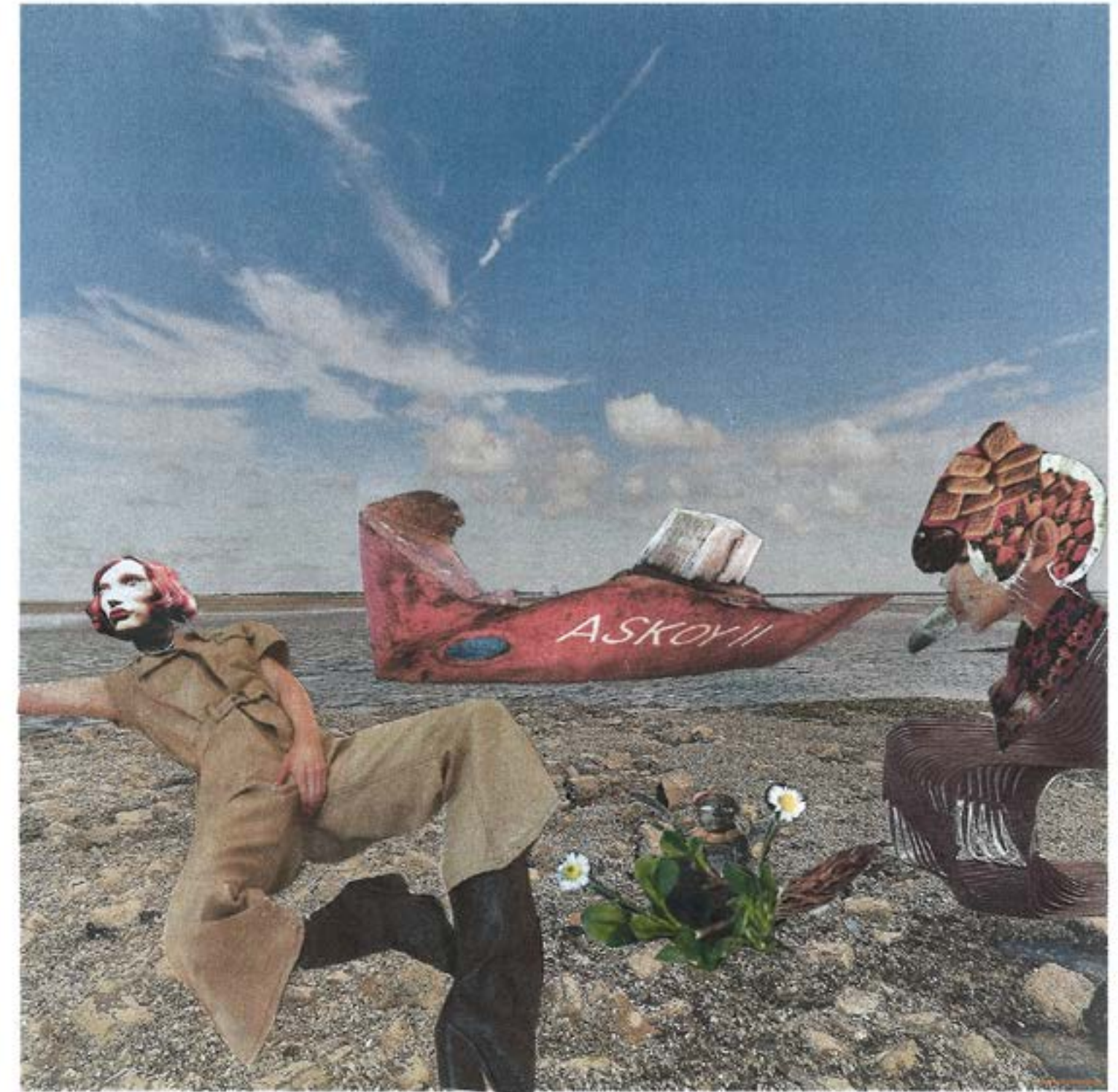
Collage: Jeannette Plantenga

Ik lag snakkend naar adem in een bed dat ik met moeite herkende. Alles leek anders: de muren, de ramen, mijn handen, tot ik mezelf weer had gevonden.