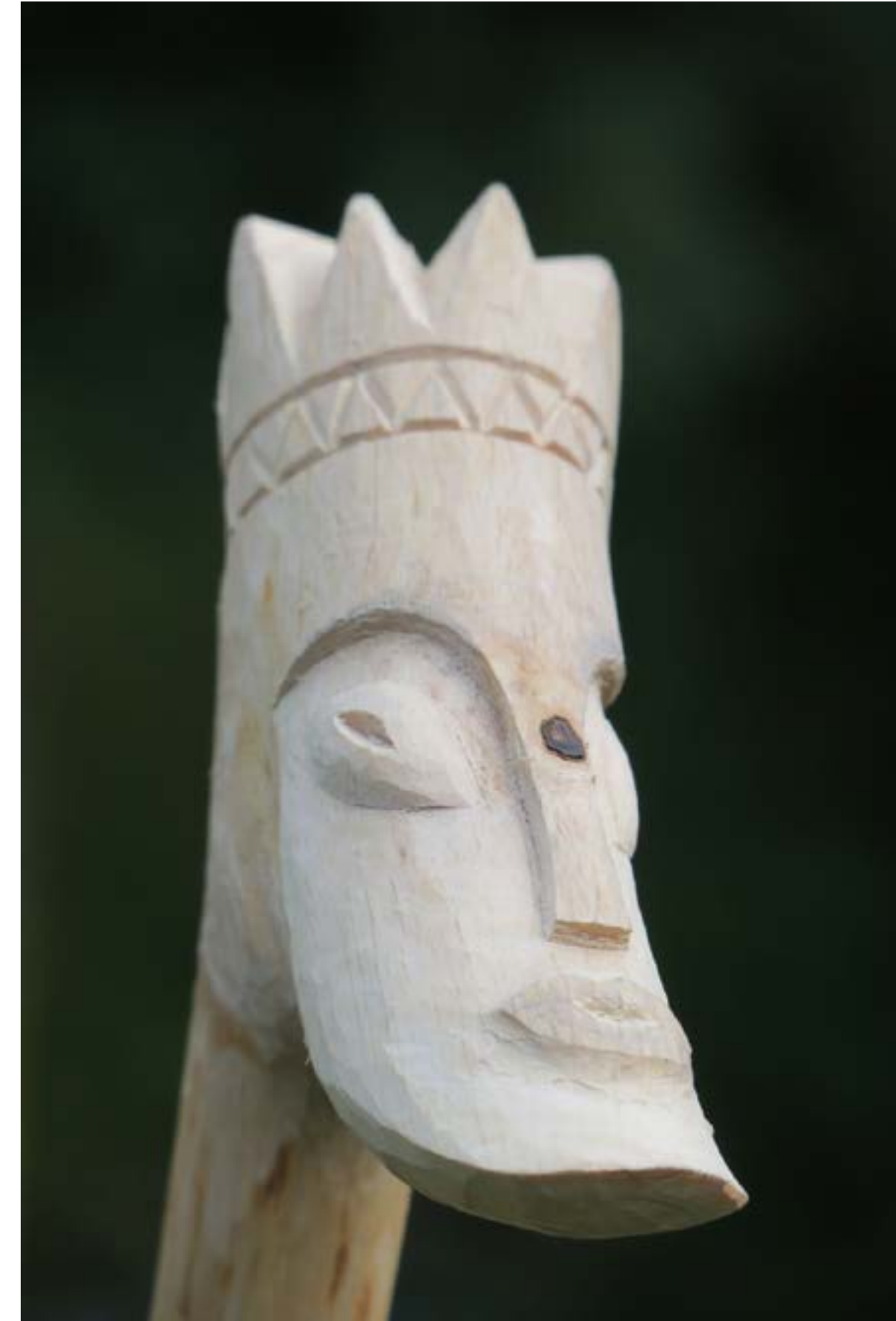
Beeld: Rob van den Broek

Kindermoord om die ene te doden die koning van Joden zou heten. Herodes was zijn naam, met rood in de boeken geschreven.